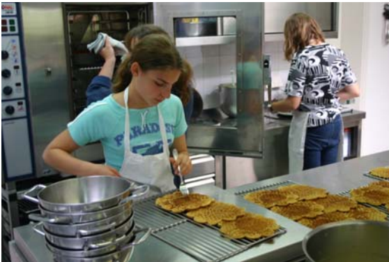
Waffeln für 30 hungrige Arbeiter

In der Küche bereiten die Schüler ihr Essen unter fachkundiger Anleitung selbst zu.