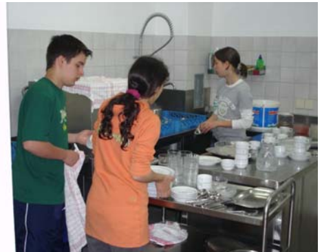
Zum Glück gibt's eine Spülmaschine