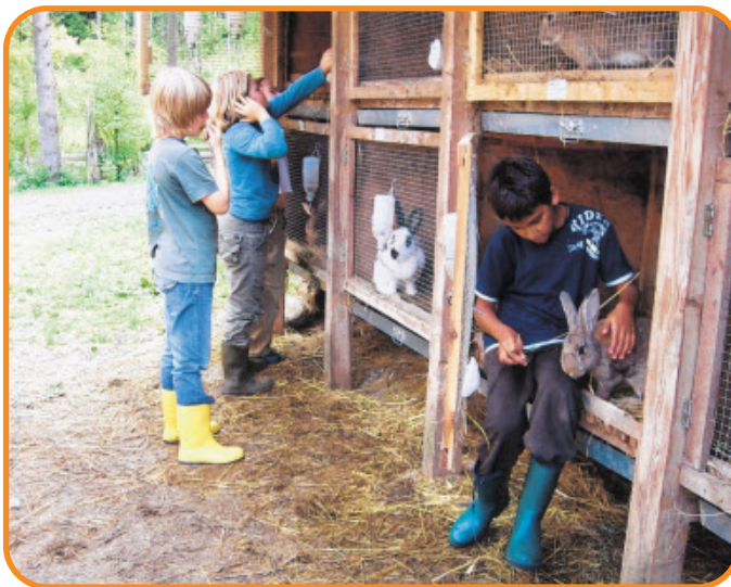
NEUN KANINCHEN leben auf dem Tannenhof. Die wurden von den Schülern der Klasse 4b gefüttert.

geführt. Nach der Kaffeepause hat die Stallgruppe die Schweine aus dem Auslauf geholt. Die Kühe wurden von der Weide geholt und gemolken. Die Hauswirtschaftsgruppe hat das Abendessen gemacht. Um 18 Uhr gab es Abendessen. Nach dem Abendessen wurde Tagebuch geschrieben, Spiele gespielt und um 21 Uhr hat Frau Fiedler-Müller in ei-