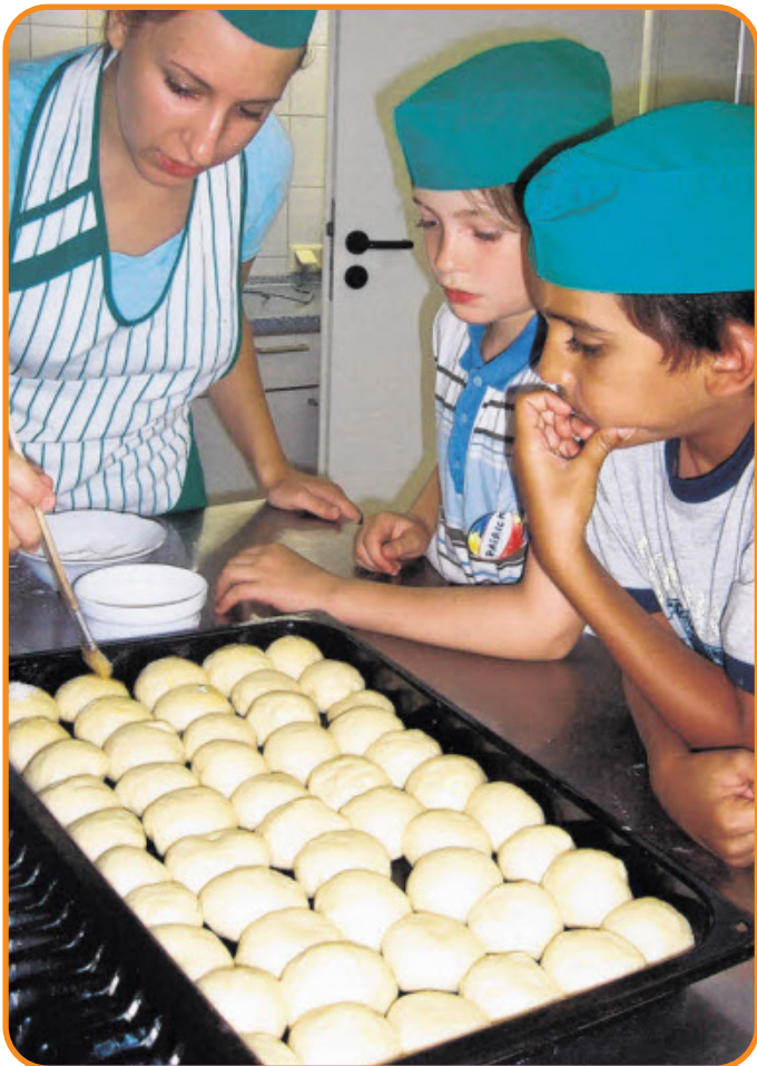
DIE HAUSWIRTSCHAFTSGRUPPE hat für alle Kinder und Lehrer das Mittagessen zubereitet.