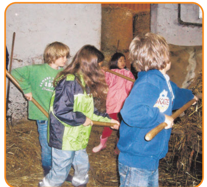
STALL AUSMISTEN gehört auch zum Alltag auf dem Bauernhof.