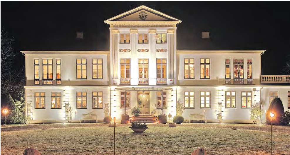
Adventlicher Glanz auf Gut Kluvensiek beim Fest der Bauernhofpädagogen der Landwirtschaftskammer.

hofpädagogik teilgenommen – wenn das kein Grund zum Feiern ist! 20 Teilnehmer haben am diesjährigen Lehrgang für Schleswig-Holstein teilgenommen und mit Erfolg abgeschlossen“, sagte Claus Heller und meinte weiter: „Ganz besonders freuen wir uns, dass wir Gäste aus dem ganzen Bundesgebiet und auch aus Österreich bei uns begrüßen dürfen. Zusätzlich zu unserem Lehrgang für Schleswig-Holstein bieten wir nämlich auch regelmäßig einen Kompaktkurs für Teilnehmer von außerhalb unseres Bundeslandes an.“