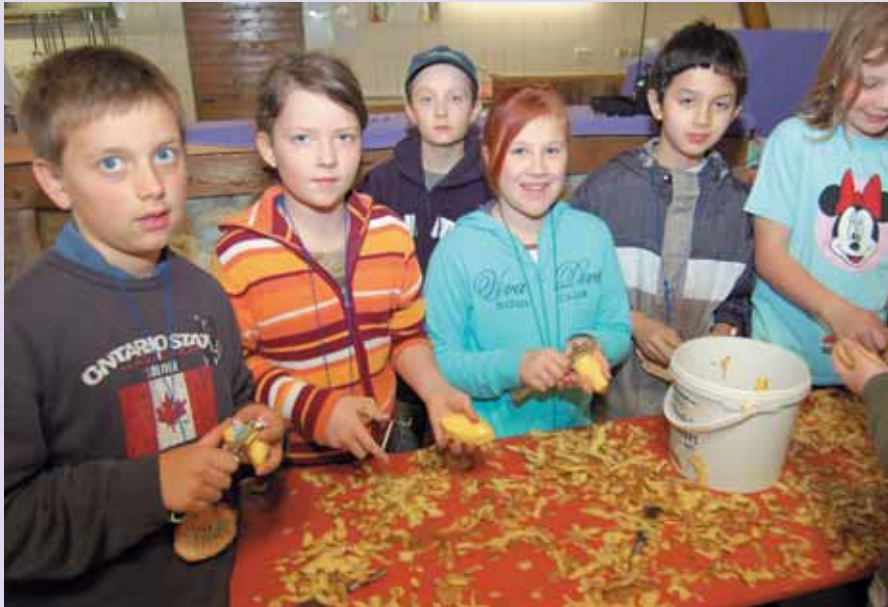
Nach all der Theorie ist wieder Praxis angesagt. Küchenpraxis. Manche stellen hier fest, dass Pommes aus Kartoffeln sind.

Nicht unerheblich, bedenkt man, dass auf dem Stettenhof 175 000 € für den Umbau des Hauses mit Schlafstellen, Küche und Einrichtungen investiert wurden. Aus der Scheune mit der alten Getreidetrocknung und Lagersilos entstand ein großes Schulungs- und Aufenthaltszentrum. „Das hat, trotz hohem Anteil an Eigenleistung und Material, noch einmal etwa 25 000 € gekostet.“ Diese Investitionen waren bereits fünf Jahre vorher für die Freizeitgruppen getätigt worden. Beim Thema Finanzierung können die Möglichkeiten der Förderungen nicht unerwähnt bleiben. Die, den Antrag auf das Schankrecht begleitende Zulassung der Gaststätte förderte die Regierung Schwabens mit einem verbilligten Darlehen für den Erhalt ländlicher Gaststätten. Den Abschluss der Ausbildung bildete eine richtige Prüfung vor Vertretern des Landwirtschaftsamtes und des Ministeriums, ähnlich einer Lehrprüfung. Erlebnisbauer/-bäuerin steht auf dem Zertifikat, das in Bayern ausgehändigt wurde.