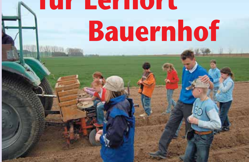
Landwirtschaft sehen, erleben und verstehen sollen Schülerinnen und Schüler auf den Bauernhöfen.