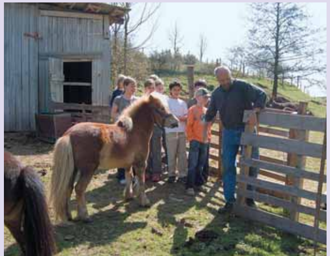
Für Kinder bedeutet ein Bauernhof Abenteuer ohne Grenzen. Gerade im Umgang mit Tieren ist Vorsicht angesagt.

Mittelpunkt und stellt, je nach Rechtsform und Trägerschaft, den Hauptbestandteil des Einkommens dar. Während diese Betriebe vielfach von dem pädagogischen Angebot „leben“ und das Angebot „Lernen auf dem Bauernhof“ daher kostendeckend (beziehungsweise gewinnorientiert) anbieten müssen, stellt der Hofbesuch für produktionsorientierte Vollerwerbsbetriebe häufig eine freiwillige Leistung dar. Auch hier ist eine Spannweite von einer kostendeckenden Aufwandsentschädigung über eine kleine Honorierung bis hin zum Nulltarif festzustellen. Letztere betrachten solche Führungen oft als Öffentlichkeitsarbeit und als Möglichkeit, Kindern ein lebensnahes Bild der Landwirtschaft zu vermitteln und verlangen daher keine Bezahlung.