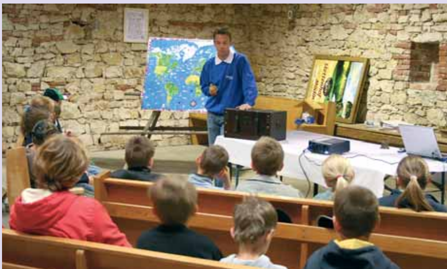
Praxis auf dem betriebseigenen Feld, Theorie in der ehemaligen Scheune. Aber keine staubtrockene, sondern eine Expedition im Zeichen der Knolle rund um den Globus.

Dazu kommen die Finanzen. Wie werden Neu- und Umbauten kalkuliert?