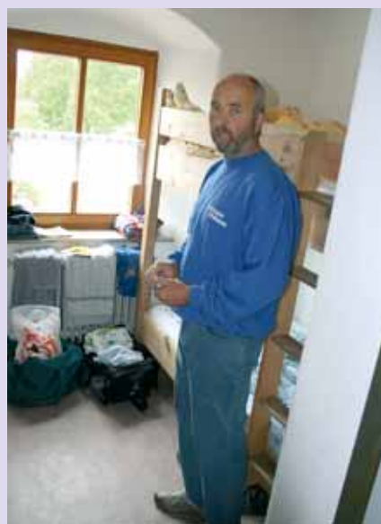
Die Kinder übernachten in den neuen Zimmern im alten Bauernhaus.

Neun- bis Zehnjährigen von der Führung, die gleich nach ihrer Ankunft und der Zimmerverteilung stattfand. Gleich zu Beginn des dreitägigen Aufenthaltes, der hauptsächlich im Zeichen der Kar-