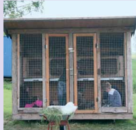
Ein Streichelzoo im Schrank erlaubt es Kindern, sich in Ruhe und ungestört mit den Lieblingen zu beschäftigen.

„Die Lehrfahrt im ersten Modul führte uns nach Hessen und Baden-Württemberg. Letzteres war besonders interessant, weil das Land eigene Schulbauernhöfe mit Angestellten hat und somit schon einiges zu erfahren war,“ erinnert